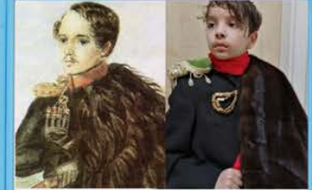
Лермонтов. Автопортрет (Бухаров Искандер)